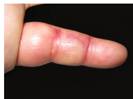
Dedo fracturado con inflamación y moretón

Las fracturas pueden causar dolor palpitante, inflamación y moretones, y el dedo podría verse deforme o fuera de lugar. También ocurre una limitación en el movimiento o una incapacidad para mover el dedo fracturado y los otros dedos. Podría haber adormecimiento si los nervios pequeños que se extienden a lo largo de los lados del dedo se han estirado o lesionado.